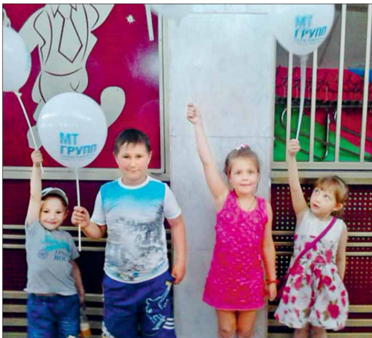
ринбурге, ради этого приехала с ребенком за 120 км, из города Миасса. Получается, что и расстояние празднику

тор «МТ-Групп» презентовал детишкам билеты в цирк. - 1 июня детки наших сотрудников от пяти до десяти лет были приглашены на замечательную программу приехавшего на гастроли цирка Филатовых. Сначала ребята вместе с родителями погуляли в парке отдыха, затем отправились на представление, которое длилось два с половиной часа. Супруга одного из наших сотрудников, пока он работал на вахте в Екате-